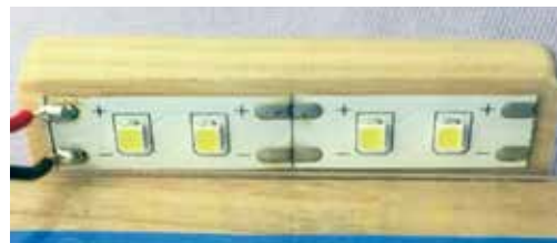
照明テープLED2ユニット付 (4LED)