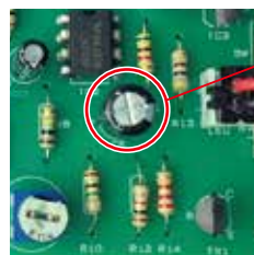
点灯時間をコンデンサの容量で調整 (10秒・1分・2分)